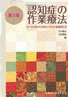
「認知症の作業療法 第2版」