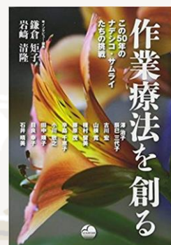
「作業療法を創る」他、多数